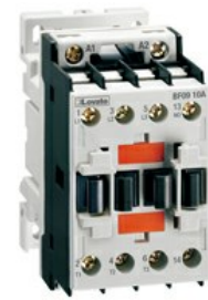
Contattore di potenza BF18